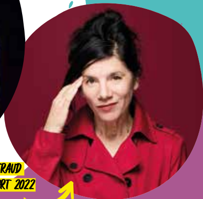
BRIGITTE GIRAUD PRIX GONCOURT 2022