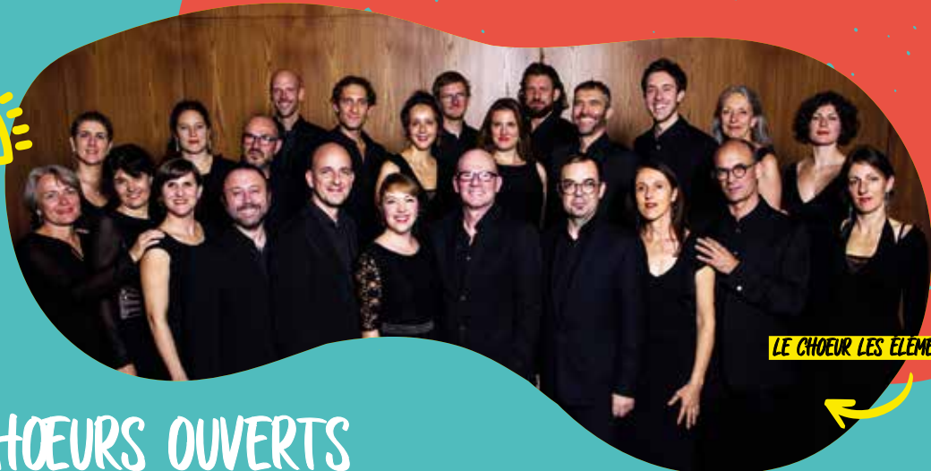
LE CHŒUR LES ÉLÉMENTS