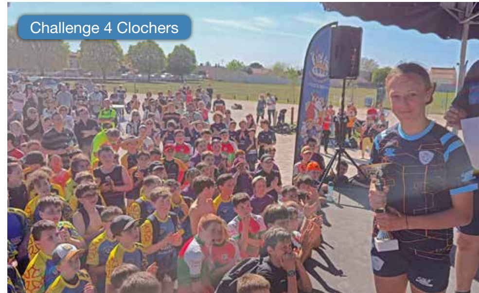
Challenge 4 Clochers