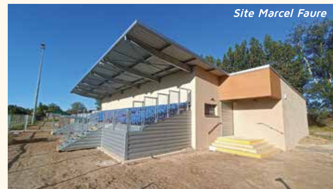
Site Marcel Faure

L'inauguration se déroulera le samedi 2 septembre dans le cadre du Forum des associations.