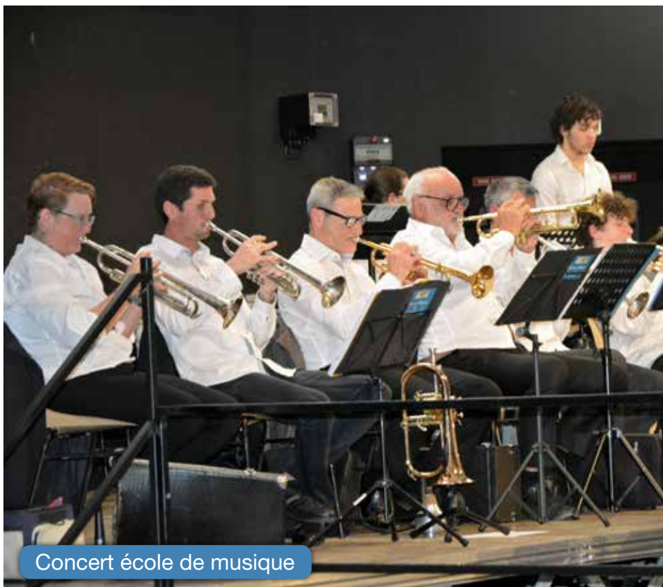
Concert école de musique