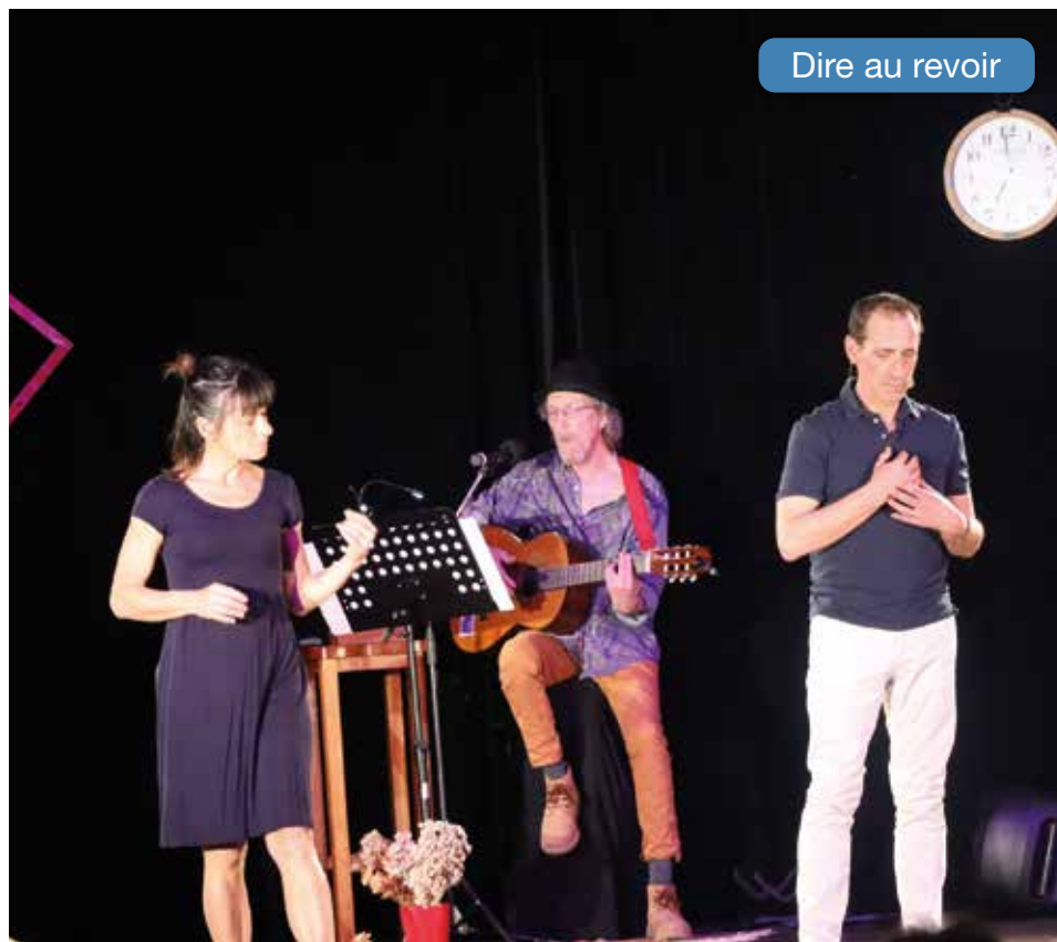
Dire au revoir