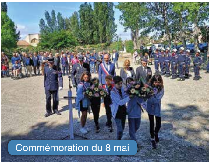
Commémoration du 8 mai