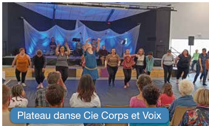
Plateau danse Cie Corps et Voix