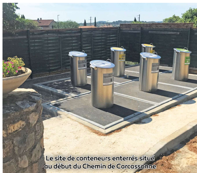
Le site de conteneurs enterrés situé au début du Chemin de Carcassonne