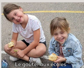
Le goûter aux écoles